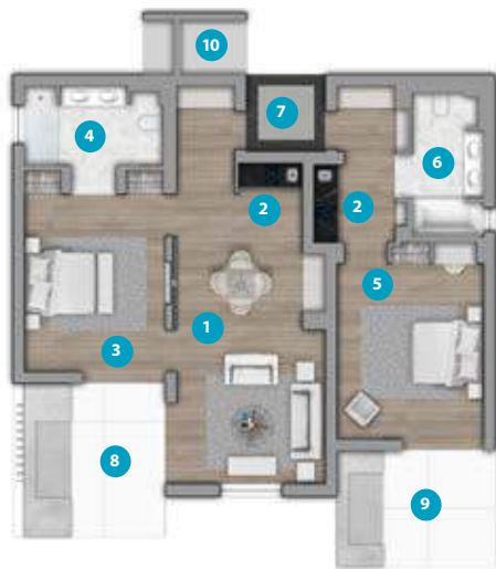
PISO 0 / GROUND FLOOR